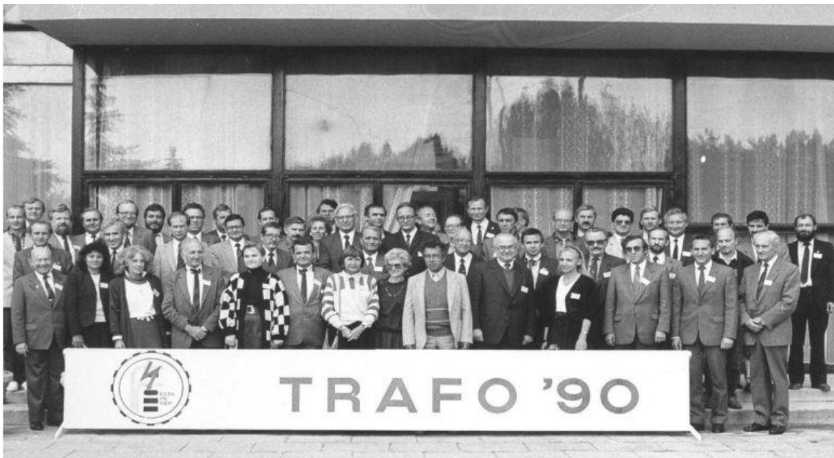
Rys. 3. Zdjęcie zbiorowe uczestników "Third International Conference on Insulation Problems in Power Transformers", Łódź wrzesień 1990 – przed drzwiami sali konferencyjnej FTiAT ELTA